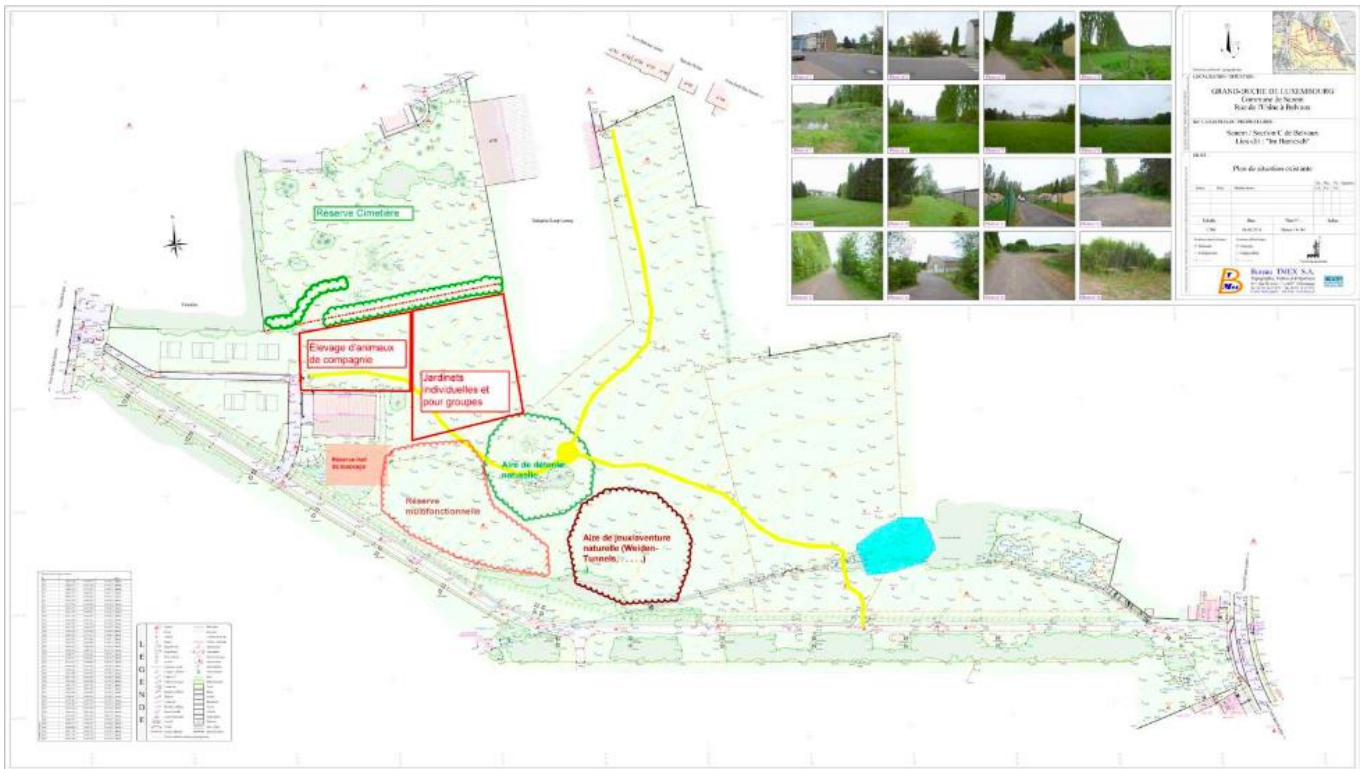
Figure 2 : Le site « Matgesfeld » dans la commune de Sanem